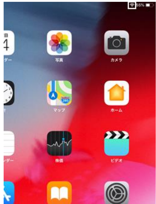
5. チェックがつくと Wi-Fi ネットワークに接続されます